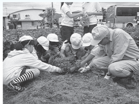
大豆の間引き作業の様子