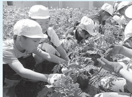
トマトの苗の植え付け作業の様子